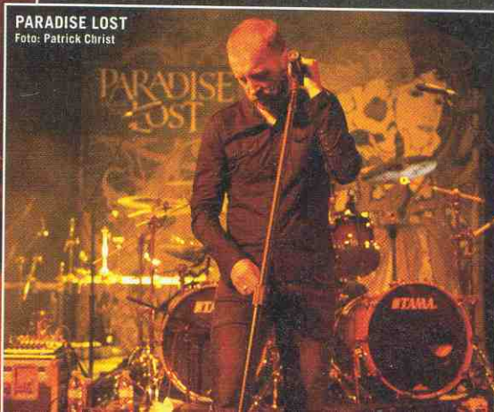
PARADISE LOST