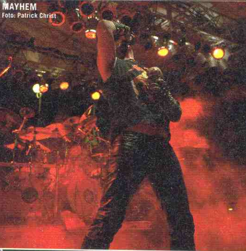
MAYHEM