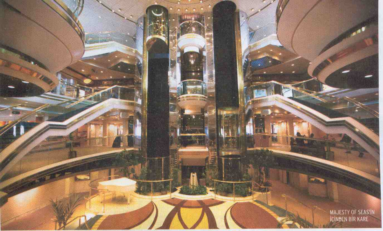
MAJESTY OF SEAS'İN İÇİNDE BİR KARE